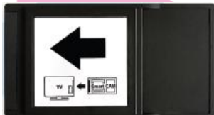
CA modul Nagra

CA modul je možné používať v prípade, ak je váš televízor vybavený DVB-S2 tunerom, ktorý umožňuje príjem satelitnej televízie v digitálnej kvalite, CI „slotom“ (zásuvkou) s podporou CI+ vo verzii minimálne 1.3 a podporou zvuku vo formáte AAC.