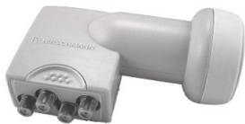
4-výstupové (quad) LNB

Po pridaní nových Boxov k Vašej inštalácii by počet výstupov na súčasnom LNB pre všetky Magio Sat Boxy už nepostačoval. Vaše 4-výstupové (quad) LNB je preto treba nahradiť 8-výstupovým (okto) LNB. Pri montáži postupujte podľa pokynov nižšie a podľa inštrukcií v Samoinštaláčnom manuáli, ktorý nájdete napr. tu: http://www.telekom.sk/podpora/magiosat