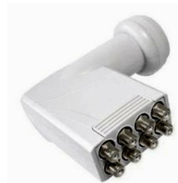
8-výstupové (okto) LNB

Ak návod popísaný nižšie pokladáte za zložitý a pomohla by Vám naša telefonická asistencia, volajte prosím Linku Podpory inštalácií 0900 211 111. Ide o volanie so zvýšenou tarifou. Linka Podpory inštalácií je Vám k dispozícii denne od 8.00 do 20.00 hod. Cena hovoru je 0,60 € za 1. minútú, následne je hovor spoplatnený 0,01 € / s. Ak prišlo v dôsledku Vášho zásahu v priebehu výmeny LNB k výpadku služby, môžete sa rozhodnúť požiadať o vyslanie nášho technika. Vyslanie technika, ktorý inštaláciu dokončí za Vás prosím objednávať cez Poruchovú linku 0800 123 777. Cena takéhoto servisného výjazdu je 55 € za jednotlivý prípad.